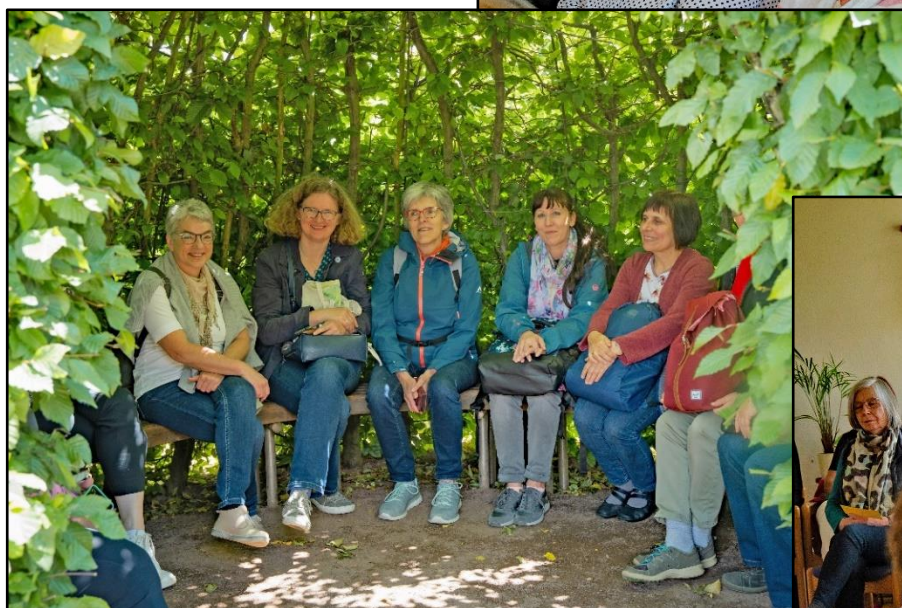
Im Hainbuchen-Dom des Labyrinths