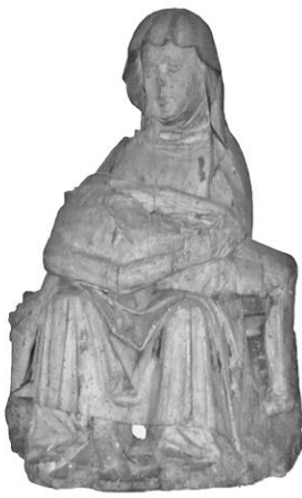
Pietea St. Anna, Stendal